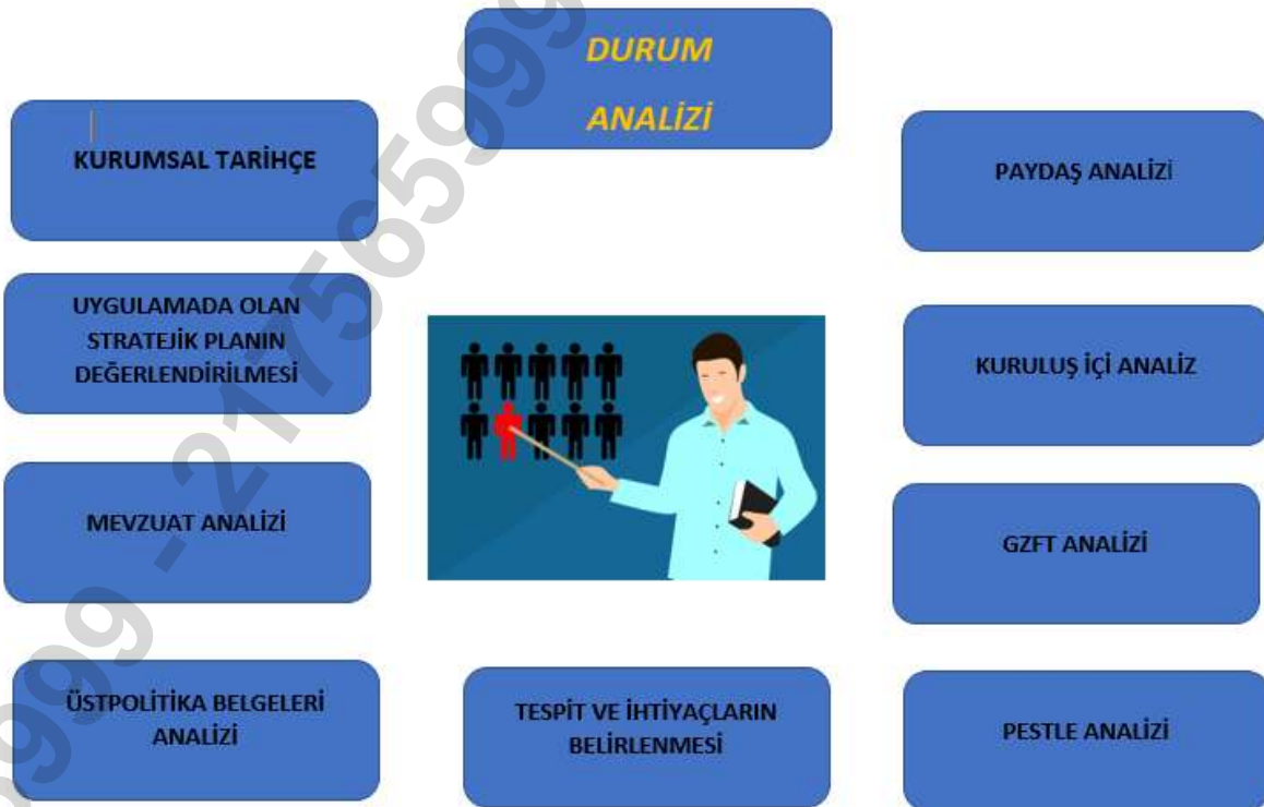
Şekil 1. Durum Analizi